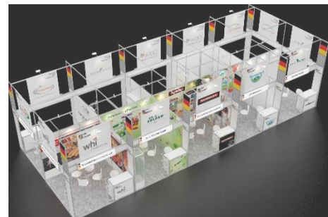
Abb. 2: Standkonzept